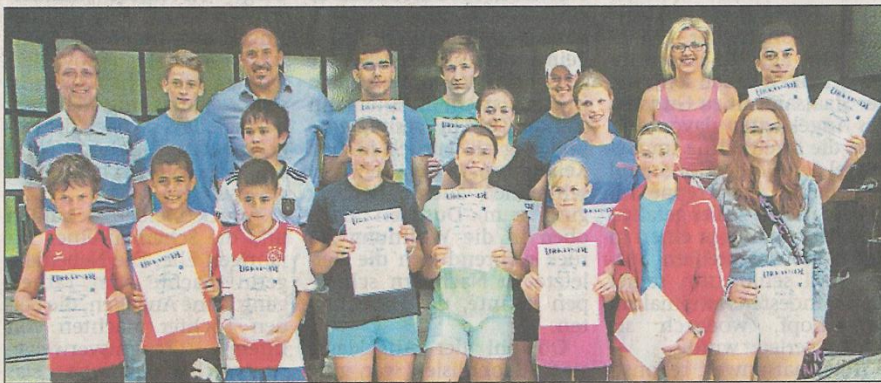
Das sind die Erstplatzierten der diversen Jahrgänge und einige der Organisatoren.

Für Unterhaltung der mehreren hundert Gäste, die sich im Laufe des Nachmittags bei herrlichem Sonnenschein im Kurpark tummelten, sorgten der Schulchor, die Schulband, Mitwirkende aus dem Fachbereich Musik der Gesamtschule sowie die Technik-AG.